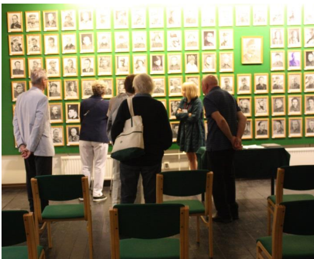
Mannerheim-ristin ritareiden kuvia katselemassa.

Varsinaisen sukukokouksen hallitus päätti järjestää Jalkaväkimuseossa Mikkelissä 22.8.2020.