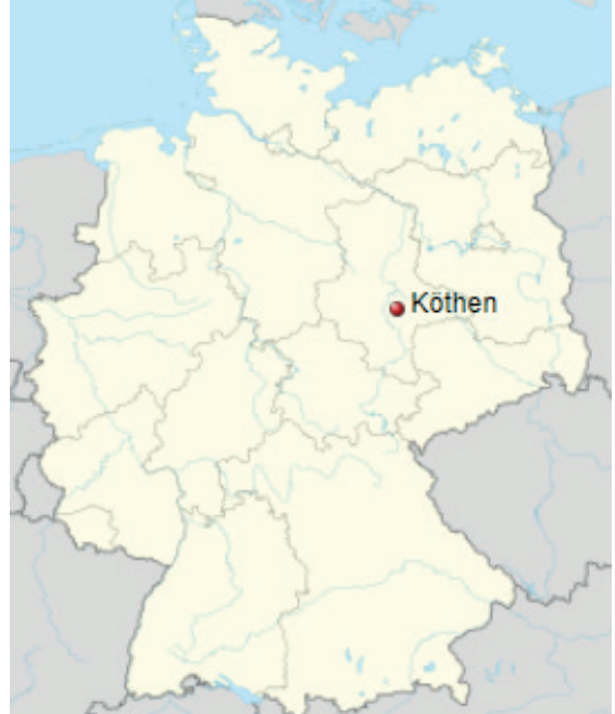
Köthenin sijainti nykyisessä Saksassa (Openstreetmap)

Piskuisen kauempana oli Leipzig, varsinaisen Saksan kirjakaupan keskus, mutta myös yksi maan tunnetuimmista yliopistoista. Ja todellinen musiikkikeskus. Siellä oli yli 1 000 kirjakauppaa ja 250 kirjapainoa, suuria kirjansitomaita ja saksalaista kirjallisuutta