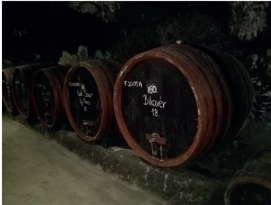
Bikavér, häränverta kypsymässä.

ongelmaa, hän oli vastannut: ”Ei mitään hätää, minä juoksen autolleni.”