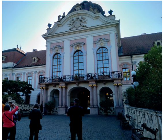
Gödöllön kuninkaallinen linna

En muista niitä lukuisia taisteluita ja sotia, joista oppaamme kertoi; vain viimeisen esimerkin muistan. Hitler houkutteli Unkarin III