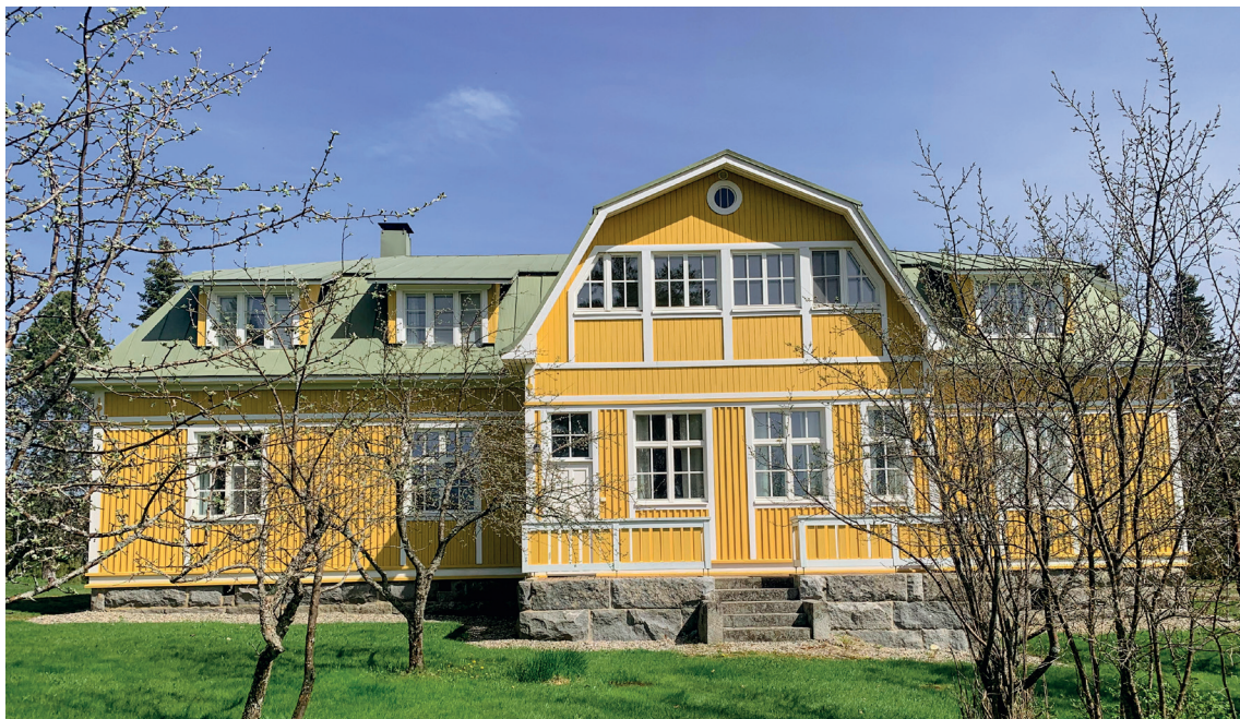
Lautalan kartano toukokuussa 2022.

Lautalan talo on eräs Pohjois-Savon vanhimmista saman suvun hallussa olevista taloista ja sen historia ulottuu lähes 500 vuoden taakse. Aikoinaan pinta-alaa tilalla oli yli 3 000 hehtaaria.