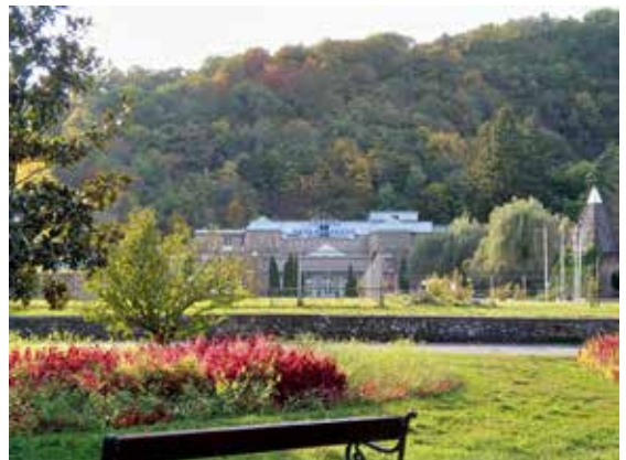
Luolakylpylä, Termal Bardakfüdrö.

tunti aikaa tutustua kaupungin keskusta. Merkittävin kohde oli Sankareiden aukiolla sijaitseva Millenium- muistomerkki, se on pystytetty unkarilaisten maahantulon 1000-vuotijuhlien kunniaksi vuonna 1896. Keskellä olevan korkean pylvään päässä on enkeli Gabrielin patsas; hän johdatti unkarilaiset heimot nykyisille asuinsijoilleen. Puolikaaren muotoisessa rivistössä pylvään kahta puolta on Unkarin kuninkaiden ja muiden historiaan merkittävästi vaikuttaneiden 14 johtajan