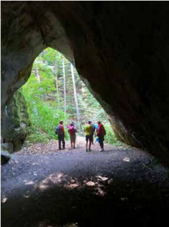
Retkeläiset lähdössä Szeletan luolalta. Luolasta on löydetty löydetty kaikkiaan yhdeksän ihmisen asuttamaa kerrostumaa.

patsaat alkaen kahdesta pyhimyksestä Pyhä Tapani ja Pyhä Ládzló