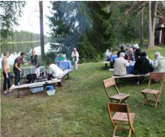
Sukupäivien lauantai-iltaa vietettiin Majakartanolla mm. rantakalan ja petanquen parissa.