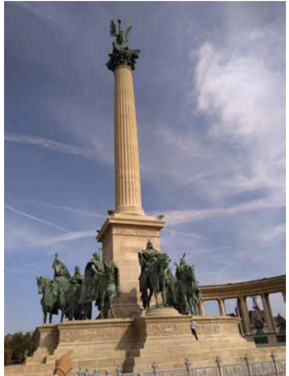
Korkea pylväs Budapestin Sankareitten Aukion keskellä, huipulla Enkeli Gabriel ja juurella unkarilaisten seitsemän heimopäällikköä.

Unkarilaiset heimot tulivat maahan Karpaattien itäpuolelta 800-luvun lopulla. Niitä oli kaikkiaan seitsemän, joista suurin oli magyaarit/madjaarit. Se nousi johtavaksi heimoksi, jonka mukaan unkarilaisten omakielinen nimikin on syntynyt. Unkarilaiset jatkoivat aluksi sotaista elämäntapaansa ja alkuun myös menestyivät, mutta joutuivat pian toteamaan, että Euroopan valtiot olivat siinä määrin vank-