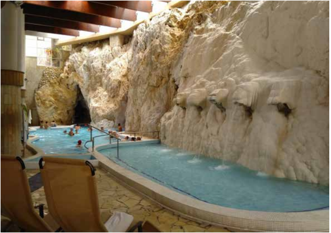
Maan alta virtaa 38 asteista vettä.

kin alamäkeen ja kohtaa jyrkemmän rinteeseen, vesi ryöppyy rinteessä, jolloin hiilidioksidia haihtuu. Tällöin kalkki irtoaa vedestä painuen pohjaan ja tarttuen pohjan kiviin, juuriin ja muihin kohoumiin. Ilmiö on sama, mikä saa aikaan esim. kahvinkeitin kalkkisaostumia. Putous on saanut epäviralliseksi nimekseen ”Huntputous”.